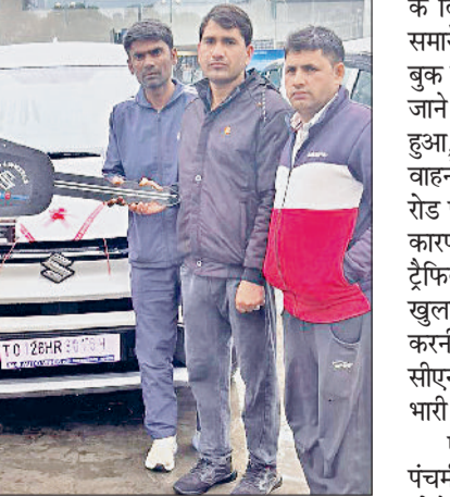
रेवाड़ी। एक शोरूम पर कार खरीदते हुए ग्राहक।

बसंत पंचमी को अबूझ साया होने के कारण शुक्रवार को बड़ी संख्या में जोड़े शादी के बंधन में बंधे। पहले से वाहन खरीदने का मुहूर्त निकलवा चुके लोगों ने कारों से लेकर दुपहिया वाहनों तक की जमकर खरीदारी की, जिससे वाहन बेचने वाले डीलरों की एजेंसियों पर शाम तक ग्राहकों की भीड़ रही। मकर संक्रांति के दिन मल मास की समाप्ति के साथ ही शुभ कार्य करने का समय शुरू हो गया था। बसंत पंचमी को