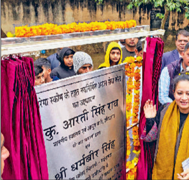
मंडी अटेली। दौंगड़ा अहीर में परियोजनाओं का उद्घाटन करती स्वास्थ्य मंत्री व कार्यक्रम में उपस्थित महिलाएं व अन्य।

स्वास्थ्य मंत्री ने धन्यवाद कार्यक्रमों में बताया कि उसको पूरी ताकत झोंक देनी है अटेली को एक नई अटेली में, क्योंकि जब उसने अटेली संचाली एवं विधायिका बनी तो देखा कि छोटी-छोटी सी चीजें अटेली में नहीं हैं। रेंट हाउस नहीं है। स्टैंडियम नहीं है, जो हर विधानसभा में होता है। आज तक बने विधायक क्यों नहीं कर पाए हैं। उसकी पूरी