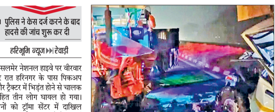
रेवाड़ी। घटनास्थल पर खड़ा ट्रैक्टर व क्षतिग्रस्त पिकअप।

गाड़ी हाइवे के डिवाइड पर चढ़ गई। पिकअप चालक व क्लीनर सहित तीन लोग इस हादसे में घायल हो गए। हरिनगर के ग्रामीणों ने घायलों को गाड़ी से निकालकर अस्पताल पहुंचाया। सूचना मिलने के बाद रामपुरा थाना पुलिस भी मौके पर पहुंच गई। हादसे में ट्रैक्टर भी क्षतिग्रस्त हो गया। चालक बाल-बाल बच गया। बाद में पुलिस ने ट्रैक्टर चालक के खिलाफ केस दर्ज कर लिया।