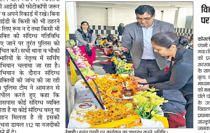
रेवाड़ी। बसंत पंचमी पर कार्यक्रम का शुभारंभ करते अतिथि।