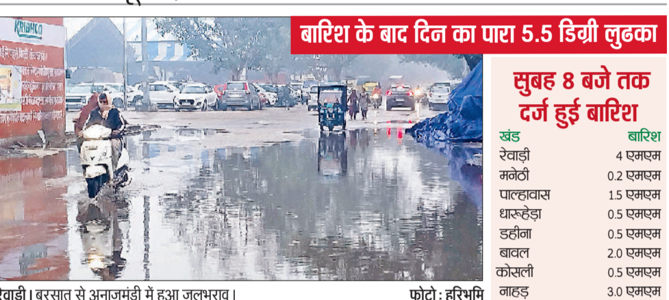
रेवाड़ी। बरसात से अनाजमंडी में हुआ जलभराव।

खंड में सर्वाधिक 4.0 एमएम और मनेठी में सबसे कम 0.2 एमएम बारिश हुई थी। इसके बाद भी बारिश काफी देर तक होती रही, जिससे औसत 10 एमएम बारिश का अनुमान है। दोपहर तक एक बार मौसम साफ होने के बाद फिर से घने बादल छा गए। अधिकतम तापमान 5.5 डिग्री की गिरावट के साथ 18.5 डिग्री सेल्सियस पर आ गया। न्यूनतम तापमान 1.5 डिग्री सेल्सियस बढ़कर 6.5 डिग्री सेल्सियस पर पहुंच गया। हवा में नमी का स्तर 80 प्रतिशत रहा। दिन में हवाएं 22 किलोमीटर प्रति घंटा की रफ्तार से चलीं। शाम तक सूरज और बादलों के बीच लुका-छिपी का खेल चलता रहा। शाम के समय फिर से तेज बारिश शुरू हो गई। मौसम विभाग के अनुसार पश्चिमी विक्षोभ की सक्रियता के चलते 24 जनवरी को भी आसमान में बादलों के बीच बूढ़ाबांदा या हल्की बरसात हो सकती है। ओलावृष्टि से भी इनकार नहीं किया जा रहा है। इस दौरान तापमान में उतार-चढ़ाव बना रहेगा। इस दौरान कोहरे और कड़ाके की ठंड का प्रकोप एक बार फिर से देखने को मिल सकता है।