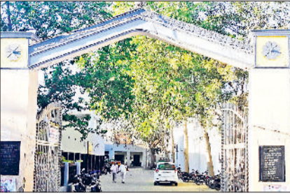
पार्श्वों को सम्मान नहीं तो बिल पास नहीं नया महेंद्रगढ़ शहर क्षेत्र के अंदर किसी भी सरकारी प्रशासनिक और किसी भी सरकारी कार्यक्रम नेता या अन्य किसी भी कार्यक्रम में शहर सरकार से बिना विचार-विमर्श किया, प्रधान, उप प्रधान व पार्श्व को नहीं बुलाया जाने और उनको उचित मान सम्मान नहीं दिए जाने पर नगर पालिका के द्वारा उठाए जाने वाले किसी भी तरह के खर्च के लिए कोई भी बिल को अद्वयगी नहीं किए जाने बारे विचार होगा।

शहर के शॉपिंग कॉम्प्लेक्स की दुकानों के ऊपर बने अवैध रूप से चौबारों में दुकानों को नियमित करने, हाउस की सहमति से इस प्रस्ताव की तय सीमा के अंदर अनुपालन करने वाले दुकानदार पर किराया नहीं मरने की वजह से पीपी एक्ट के तहत केस या व्याजालय में लिखित समी तरह के मुकदमों को वापस लिए जाने बारे विचार, शॉपिंग कॉम्प्लेक्स के दुकानदारों पर काफ़ी वर्षों से बकाया रेंट पर लगे पेन्ल्टी और ब्याज माफ़ करने के लिए विस्तृत रिपोर्ट बनकर सरकार के पास भेजने बारे विचार, शॉपिंग कॉम्प्लेक्स के अंदर जर्जर हो चुके लैटर को छत को ठीक करने बारे विचार किया जाएगा। ऑटो मार्केट की दुकानों के ऊपर नगर पालिका द्वारा बनाए गए चौबारों को खुली बोली या चौबारों के नीचे बनी दुकानों के किरायेदारों को शर्तों के साथ देने बारे विचार, गांधी मार्केट में नगर पालिका की दुकानों को ऊपर बने चौबारों के ऊपर चढ़ने के लिए सीढ़ियां बनाने और चौबारों की मरम्मत करवाने को लेकर तथा मौहल्ला सैनीपुरा में नगर पालिका की दुकानों की मरम्मत करवाने बारे विचार किया जाएगा। नगर पालिका के देवीलाल पार्क के पास या अन्य किसी भी स्थान को विहित कर रेहडी मार्केट बनाने बारे विचार, नगर पालिका के द्वारा बनाई गई नई सड़क मार्ग को पब्लिक हेल्थ विभाग द्वारा तोड़े जाने पर उचित कार्रवाई करने बारे विचार किया जाएगा। बिजली निगम द्वारा नगर पालिका की जमीन पर लगाए गए पोल व ट्रांसफॉर्मर आदि पर रेंट वसूलने को लेकर पर चर्चा की जाएगी।